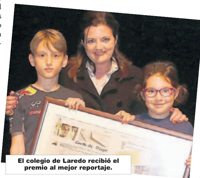
El colegio de Laredo recibió el premio al mejor reportaje.

Cooperativismo, constructivismo, trabajo por proyectos, métodos tradicionales, innovadores... Todo tipo de metodologías docentes comprometidas en el desarrollo integral del alumnado. La diversidad del mismo, sus "diferencias" favorecen diferentes enfoques para un único fin, el desarrollo y aprendizaje del alumnado. Los artículos realizados para nuestro proyecto es fiel a ese compro-