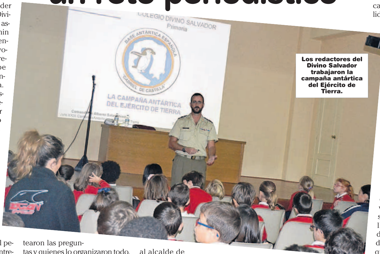
Los redactores del Divino Salvador trabajaron la campaña antártica del Ejército de Tierra.