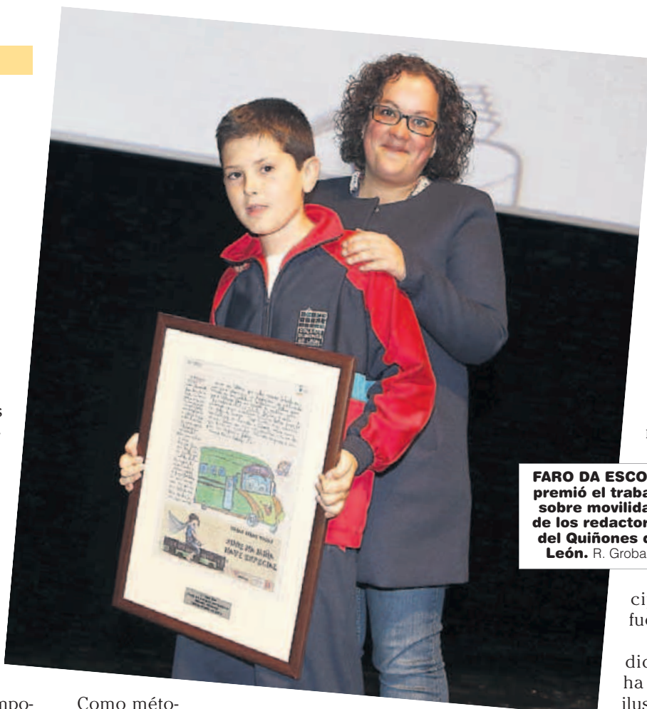
FARO DA ESCOLA premió el trabajo sobre movilidad de los redactores del Quiñones de León. R. Grobas

El periódico nos sirvió para que los alumnos vean reforzado su esfuerzo de manera eficaz, interiorizando su propio aprendizaje y dando suma importancia al camino que ha llevado al mismo, nos sirvió también para potenciar la interrelación personal, la búsqueda de datos, la investigación, la estética, la composición y el desarrollo de la plástica la imagen; un elemento integrador.