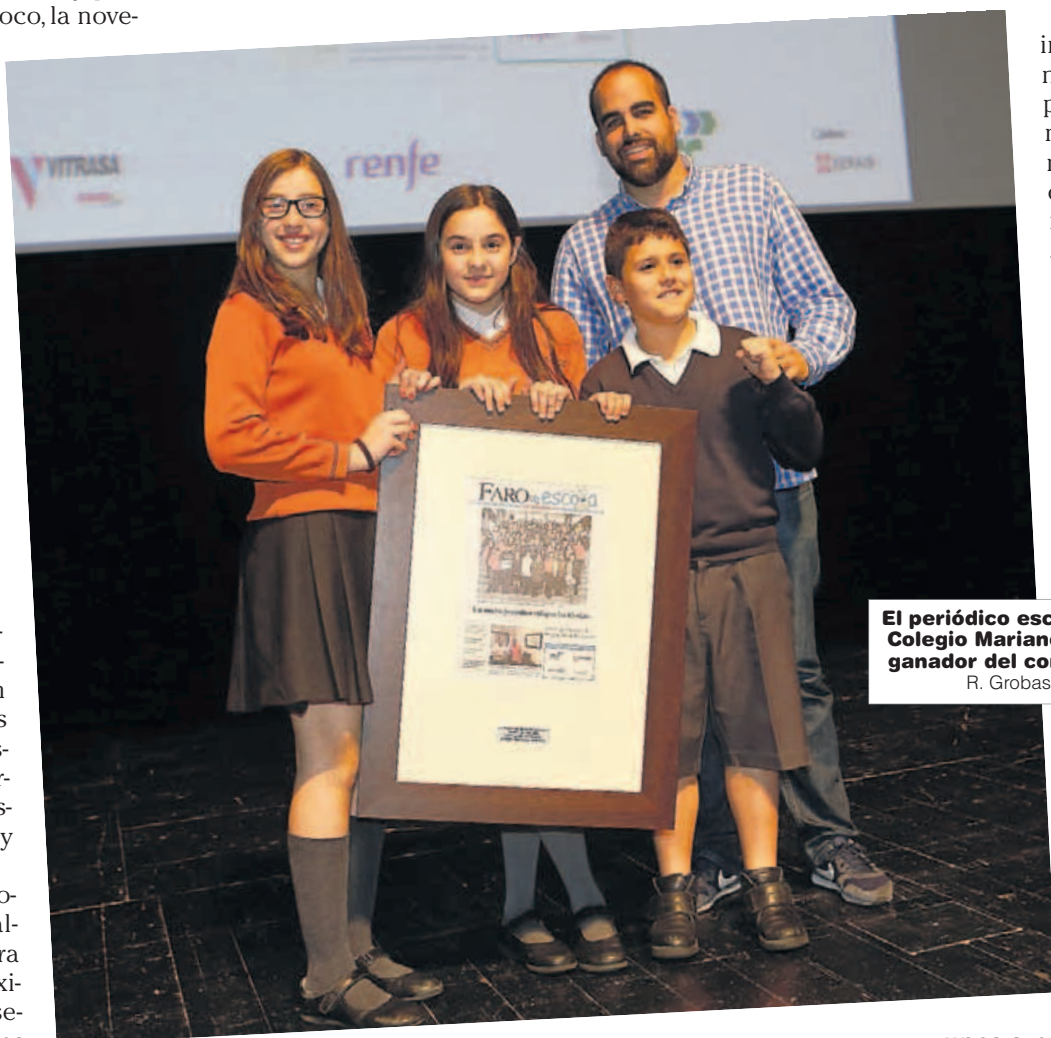
El periódico escolar del Colegio Mariano fue el ganador del concurso.

Cuando algún profesor nos enseña algo, sea la asignatura que sea, el mayor éxito que puede conseguir el profe es vernos