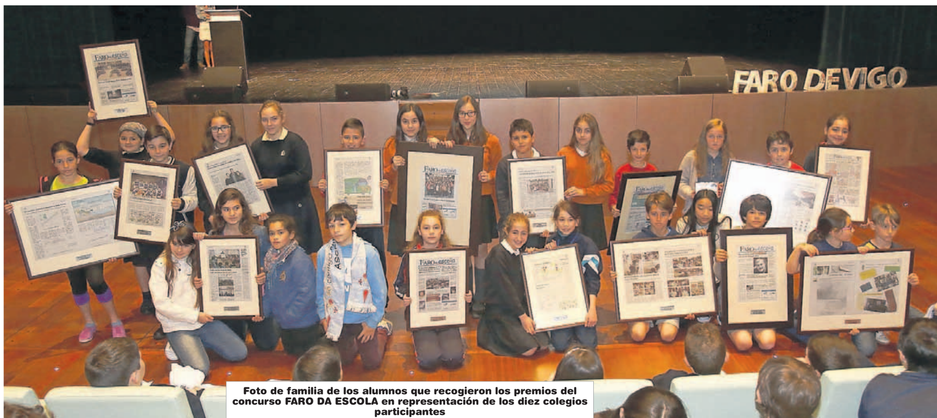
Foto de familia de los alumnos que recogieron los premios del concurso FARO DA ESCOLA en representación de los diez colegios participantes