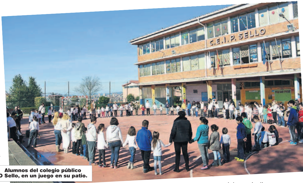
Alumnos del colegio público O Sello, en un juego en su patio.