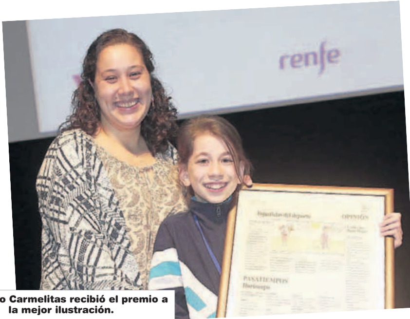
El colegio Carmelitas recibió el premio a la mejor ilustración.

algunas de las que ellos han utilizado para referirse a la experiencia vivida.