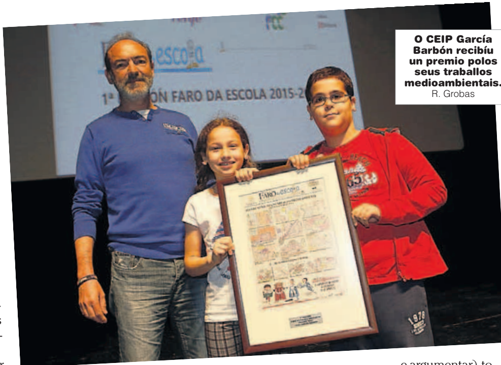
O CEIP García Barbón recibiu un premio polos seus traballos medioambientais. R. Grobas

Los redactores del Divino Salvador trabajaron la campaña antártica del Ejército de Tierra.