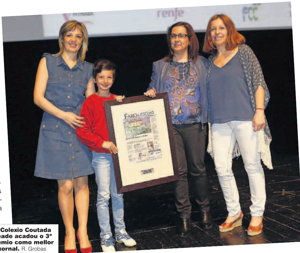
O Colexio Coutada Beade acadou o 3º premio como mellor xornal. R. Grobas

na elección dos temas e na redacción. Unha vez rematada viña o proceso de revisión, pulir frases, corrección, onde basicamente as mestras eran guías do traballo de