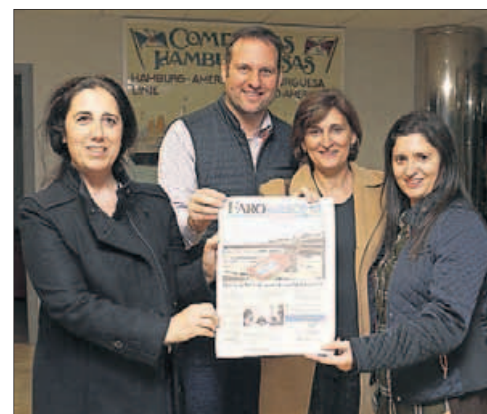
CPR Nuestra Señora Esperanza ■ “Fue didáctico: les sirvió para aprender a redactar; ellos querían llenar el diario de fotografías”.