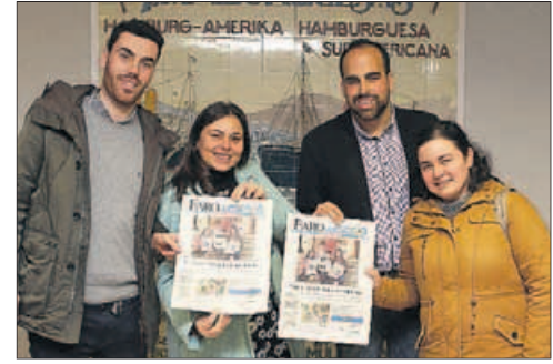
CPR Mariano ■ “La fase final les gustó mucho, trabajaron en grupo. Es una forma diferente de aprender, mientras se divierten”, aseguraron.