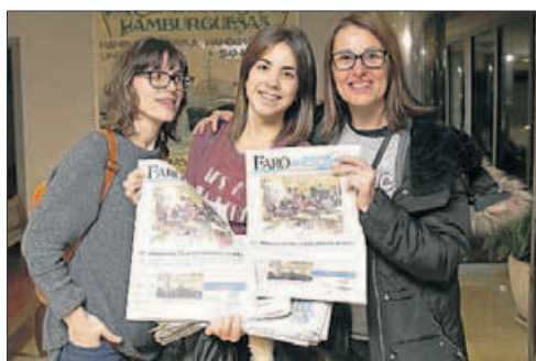
CPR Mercantil ■ “Contamos lo que se hace en el barrio y en el cole, además de introducirnos en un campo de refugiados”, afirmaron.