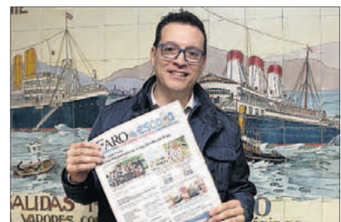
CEP Santa Tegra-Teis ■ “Expusimos cómo entendemos nosotros la escuela con realidad aumentada y virtual”, aseguró Manel.