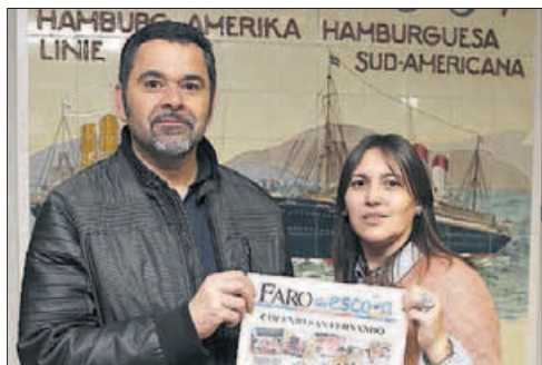
CPR San Fernando ■ “Nos encantó ver la ilusión de los chicos, acostumbrados a ver el diario en el quiosco y sentir ahora que es propio”.