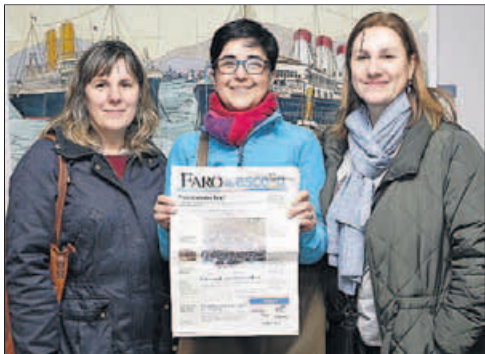
CPR Vigo ■ “Primó el trabajo en equipo”, dijeron los profesores, que destacan el trabajo de investigación y las entrevistas de sus alumnos.

En esta segunda edición, el número de participantes se ha incrementado hasta en un 100%. FARO NA ESCOLA ha contado con los colegios vigueses de Las Acacias, García Barbón, O Sello, María Inmaculada-Carmelitas, Mariano, San Fernando, Possumus, Alba, Nuestra Señora de la Esperanza,