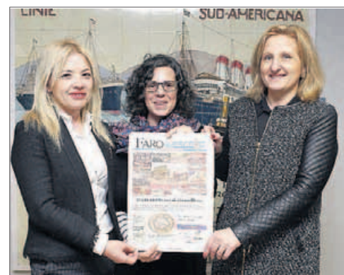
CEIP Mosteiro-Bembrive ■ “Fue una gran motivación para los alumnos hacer noticias; les encantó acercarse a la realidad”, indicaron.